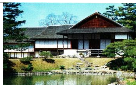
『詳説日本史 B』(山川出版社)より引用